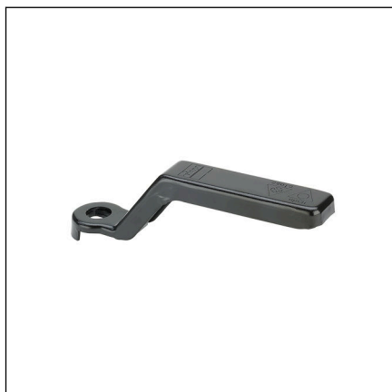
Fig. 2: Modèle 2270.26 levier de commande Easytop en métal