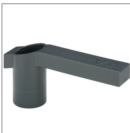
Fig. 1: Modèle 2270.21 levier de commande Easytop en matière plastique