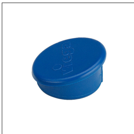
Fig. 3: Modèle 2270.23 coiffe de protection bleue