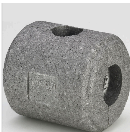
Fig. 4: Modèle 2210.40 coque isolante Easytop

Les coques isolantes en EPS sont disponibles pour toutes les tailles de vanne à bille. Les coques en deux parties sont auto-fixantes et se montent sans outils ni griffes de maintien. Elles épousent parfaitement les faces avant de l'isolation des tuyauteries.