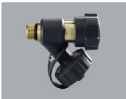
Slika 2: Model 2234 Easytop ventila za pražnjenje s navojnim priključkom G ¼