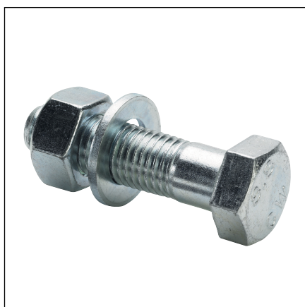
Slika 3: Model 2259.7 / XL montažna garnitura