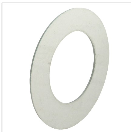
Slika 4: Model 2259.9 / XL brtva